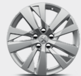
Cerchi in lega 17" CHICAGO*

Sottolineate la vostra personalità con uno dei quattro tipi di cerchi: potete scegliere tra diametri e tonalità diverse, per rendere il vostro SUV Peugeot 3008 un insieme davvero perfetto.