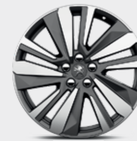
Cerchi in lega 19" WASHINGTON bi-color diamantati / grigio brillante***

* Di serie, in opzione o non disponibile secondo le versioni. ** In opzione su Active. *** In opzione.