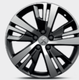
Cerchi in lega 18" DETROIT bi-color diamantati / nero brillante**