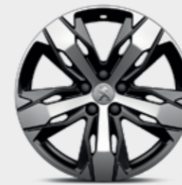
Cerchi in lega 18" LOS ANGELES bi-color diamantati*** con Advanced Grip Control®