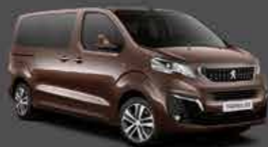
Marrone Rich Oak*