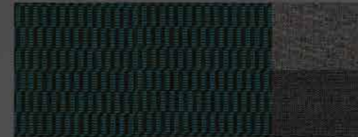
Tessuto Cran Bleu sulla versione Active