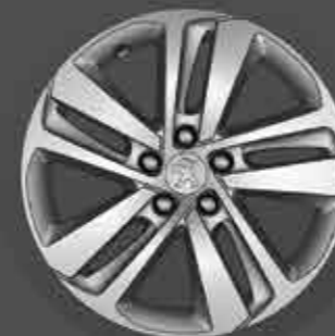
Cerchio in lega Phoenix 17" ***