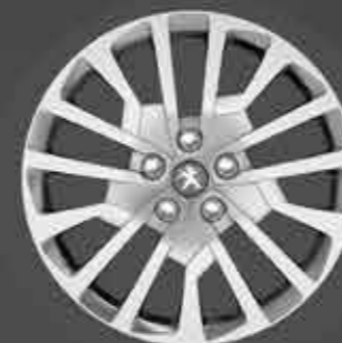
Copricerchio Miami 17" **