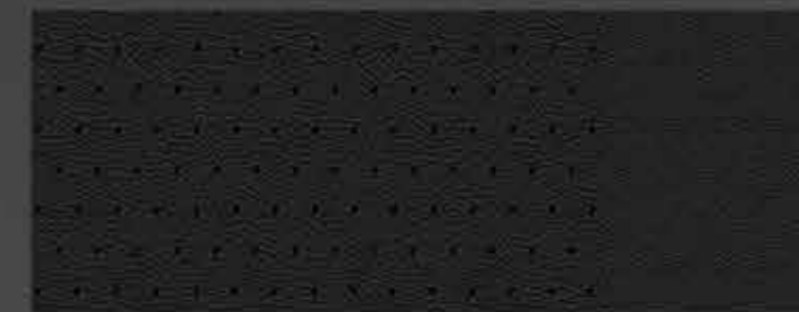
Pelle Claudia cuciture Beige Impala sulla versione Allure