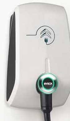
PRESA TIPO GREEN'UP (14 A) RICARICA IN 4H