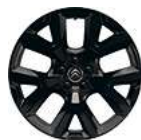
CERCHI IN LEGA 19" ART BLACK*