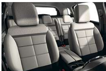
AMBIENTE METROPOLITAN BEIGE**