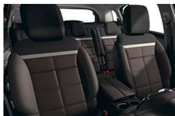
AMBIENTE HYPE BROWN**