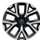
CERCHI IN LEGA 19" ART*