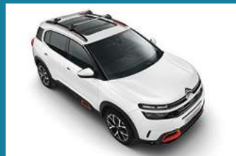
BARRE TRASVERSALI AL TETTO