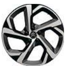
CERCHI IN LEGA 18" SWIRL