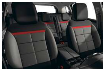
AMBIENTE WILD GREY EVO**