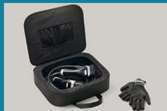
CUSTODIA PER CAVO DI RICARICA