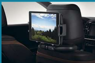
SUPPORTO PER DISPOSITIVI MULTIMEDIALI