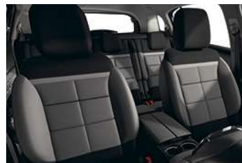
AMBIENTE METROPOLITAN GREY**